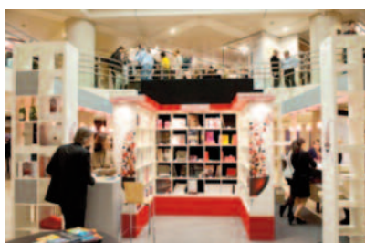
La boutique du Grand Tasting