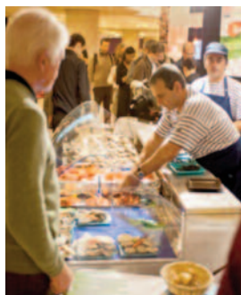
Les Bars Gourmets