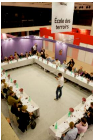
Ecole des Terroirs

Les Master Class, les Ecoles des Terroirs et les Ateliers Gourmets ont tous cartonné. Chacun est une expérience remuante d'où l'on ressort grandi, enrichi. On va plus loin, au bout de son amour du vin, et ce n'est pas tous les jours qu'autant d'animateurs passionnés, des chefs aux experts du vin de l'équipe Bettane+Desseauve, sont réunis et prennent le temps de tout expliquer en petit comité à un public d'amateurs avertis.